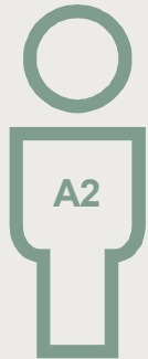
Kontant- eller uddannelseshjælp

Det betyder en samlet udgift for kommunen på 196.172 kr. årligt pr. borger. Segmentet udgør 494 borgere i de undersøgte kommuner.